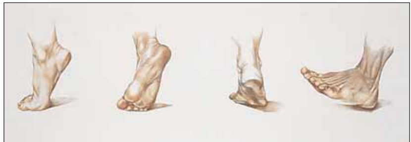
DEAMBULAZIONE stampa litografica art. 13.81.013 (cm. 112 x 37)