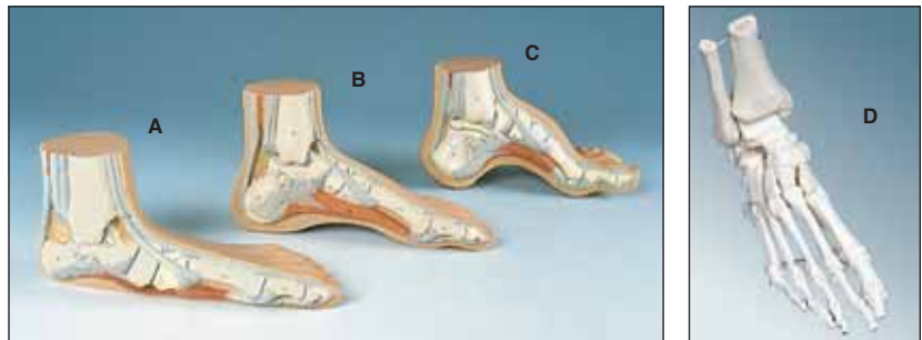
MODELLI DA ESPOSIZIONE E STUDIO A GRANDEZZA NATURALE