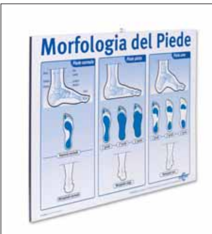
Tavola montata su supporto di materiale espanso, lato immagine con plastificazione opaca antiriflesso: MORFOLOGIA DEL PIEDE art. 13.81.008 (cm. 66,5 x 48)