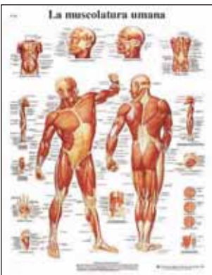
LA MUSCOLATURA UMANA art. 13.81.003 (cm. 50 x 67)