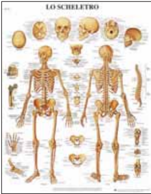
LO SCHELETRO art. 13.81.015 (cm. 50 x 67)