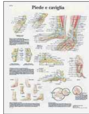
ARTICOLAZIONE PIEDE E CAVIGLIA art. 13.81.016 (cm. 112 x 37)