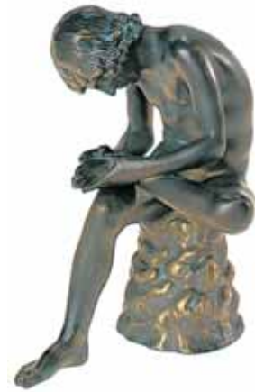
STATUA IN BRONZO ESPINARIUS art. 13.81.022 (cm. 15 x 19,5) kg 2,8