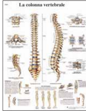
LA COLONNA VERTEBRALE art. 13.81.004 (cm. 50 x 67)